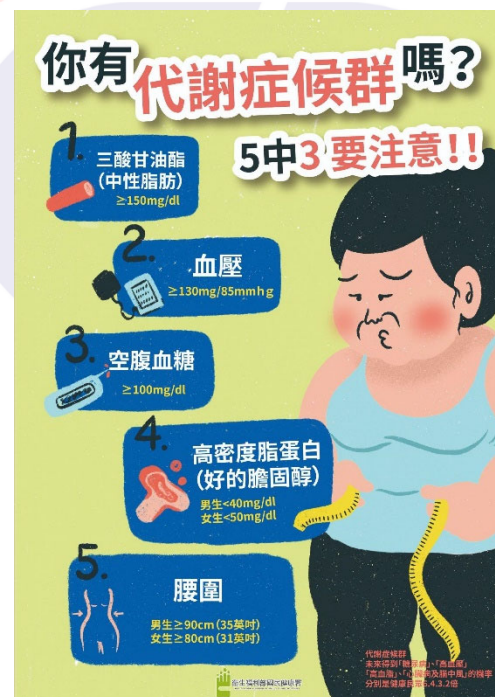
圖1：你有代謝症候群嗎？5中3要注意！！

些可能屬於疾病前期，個案也處於亞健康狀態的代謝症候群患者，過去並沒有很好的追蹤管理辦法可供基層醫療院所遵行，也沒有相關的給付規定。國健署代謝症候群防治計畫，等於是過去成人預防保健的後續追蹤與擴大執行，透過推行此計畫，結合疾病前期之危險因子防治，由醫療專業人員指導病患增進自我健康管理識能，以期達到慢性病防治的目的，減輕後續健保醫療資源負擔並提升給付效率。