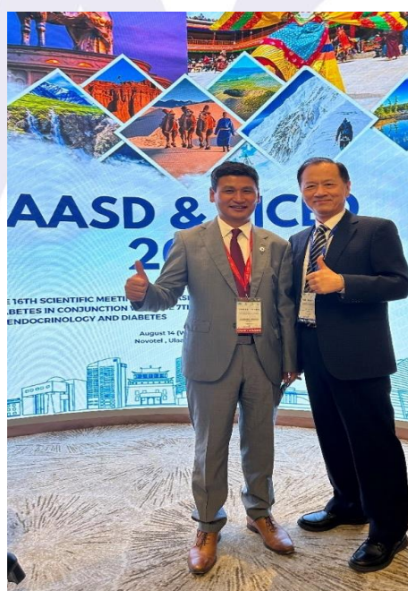
圖片四：與此次大會蒙古籍主席Khasag教授合影。