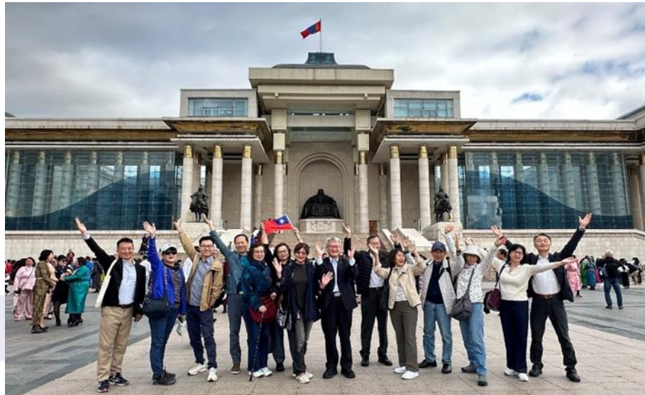
圖片二：參與大會的台灣代表在蒙古市政大廳廣場前舉國旗合影

尿病盛行率，肥胖，肌少症，營養失調及脂肪肝等議題。比較特別的是蒙古國的糖尿病盛行率，據統計從1999年的3.1%上升到2019年的8.3%，但是報告者也承認應該是廣大的遊牧民族，無法全面進入全國性的登錄系統內導致數目失真。