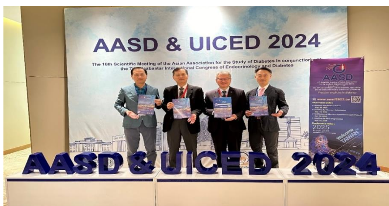
圖片三：糖尿病學會前後任理事長，共同歡迎各國代表明年至台灣參加AASD大會。

感謝獲得台灣基層糖尿病協會之資助，本人得以參加亞洲糖尿病研究學會(AASD)會議，謹此致謝。