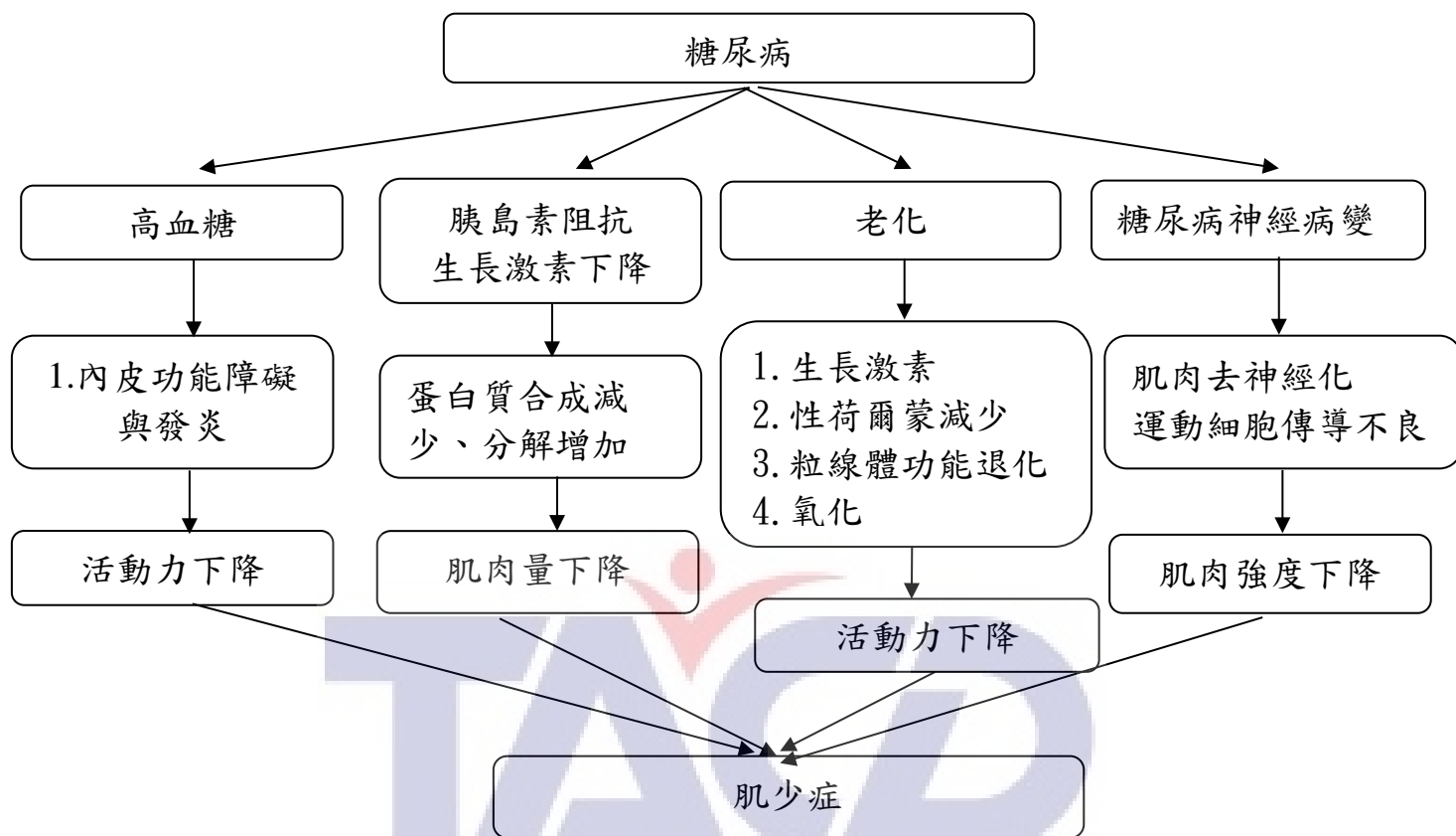
圖一、糖尿病肌少症的病理機轉